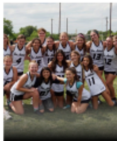
GIRLS HIGH SCHOOL JV AND VARSITY GRADES 9-12