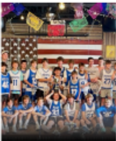
MIDDLE SCHOOL GRADES 5 THROUGH 8