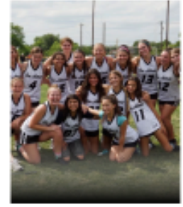
GIRLS YOUTH DEVELOPMENTAL