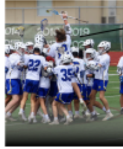
BOYS HIGH SCHOOL