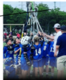
ELEMENTARY BOYS AND GIRLS WELCOME GRADES K-4