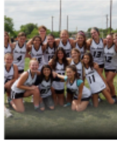
GIRLS HIGH SCHOOL