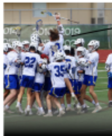
BOYS HIGH SCHOOL JV AND VARSITY GRADES 9-12