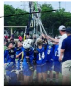
ELEMENTARY BOYS AND GIRLS WELCOME GRADES K-4