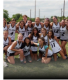
GIRLS YOUTH DEVELOPMENTAL