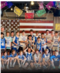
MIDDLE SCHOOL GRADES 5 THROUGH 8