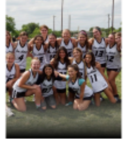
GIRLS YOUTH DEVELOPMENTAL