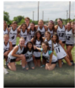
GIRLS YOUTH DEVELOPMENTAL