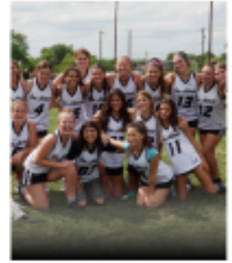
GIRLS YOUTH DEVELOPMENTAL